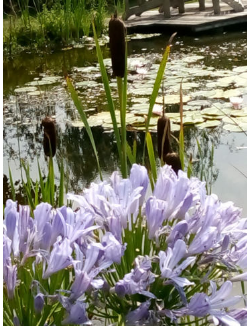
Beleving van een tuin