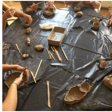
Impressies uit de Ont-moeting