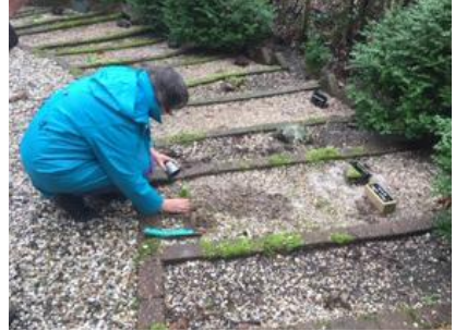
Afscheid An van Tol